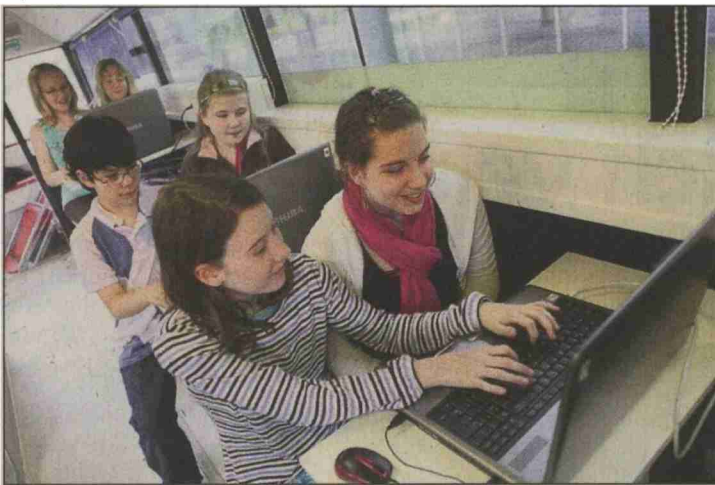
Im Cyber-Bus lernen die Kinder Gefahren des Internets kennen. Beat Mathys

Ein Cyber-Bus steht vor dem Schulhaus Altikofen in Worblaufen. Dort lernen die Schüler den richtigen Umgang mit dem Netz.